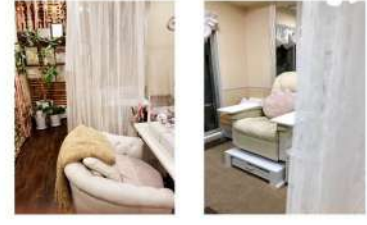
気になるお客様にはカーテンで仕切られるお席へご案内いたします