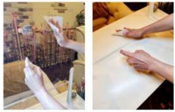
接客毎にテーブルとスニーズガードの消毒を行なっています