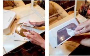
接客毎にLEDライトの消毒を行なっています