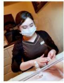
マスクとフェイスシールドを着用します